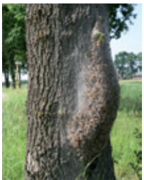
Eikenprocessierups Maarten Crezé Plagen Preventie Dienst

De eikenprocessierups is de larve van een nachtvlinder die haar eitjes legt in de toppen van eikenbomen. Daar overwinteren ze. Eind april, begin mei komen de rupsen uit de eitjes. Na een aantal vervellingsstadia zijn ze in juli volgroeid. Na de derde vervelling krijgen de rupsen brandharen. Dit is tussen half mei en eind